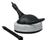
Lancia lavapavimenti SC 145