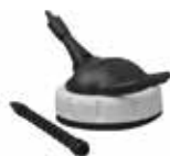
SC 145 floor cleaning lance